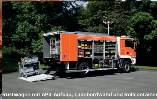
Rüstwagen mit AP3-Aufbau, Ladebordwand und Rollcontainer