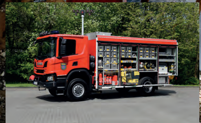
Rüstwagen RW nach DIN 14555-3