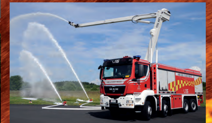
Großtanklöschfahrzeug GTLF mit Druckluftschauhsystem und Löscharm