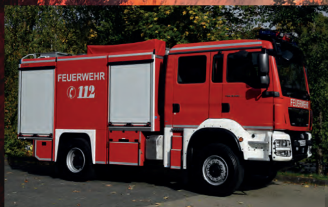
Tanklöschfahrzeug TLF 4000 St ähnlich DIN 14530-21