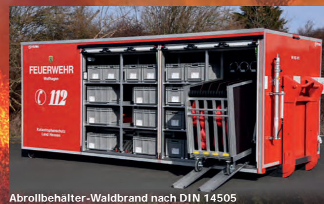
Abrollbehälter-Waldbrand nach DIN 14505