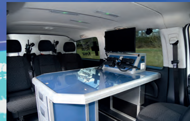
Innenansicht Einsatzleitwagen ELW 1