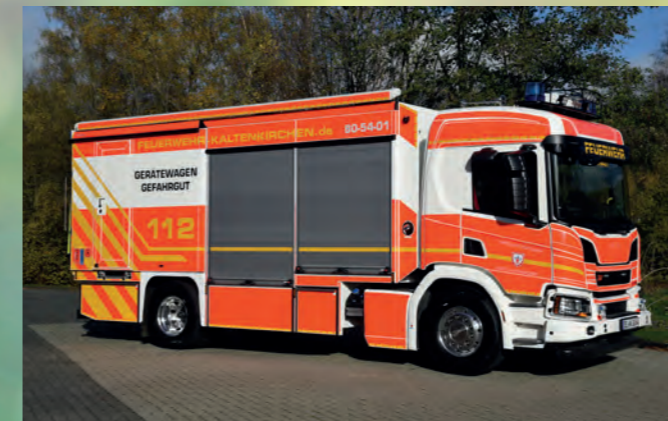
Gerätewagen-Gefahrgut nach DIN 14555-12

Fragen Sie uns unverbindlich nach unseren Möglichkeiten! Dabei profitieren Sie von umfassenden Erfahrungen im Sektor Umweltschutz.