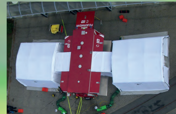
Abrollbehälter-Dekon mit An- und Auskleidezelt

Unsere FOBACON-Geräte bieten Ihnen in Verbindung mit unseren Schaumzusätzen - auch im Hinblick auf eine schnelle Einsatzbereitschaft nach den Regeln der vfdb - die optimale Lösung.