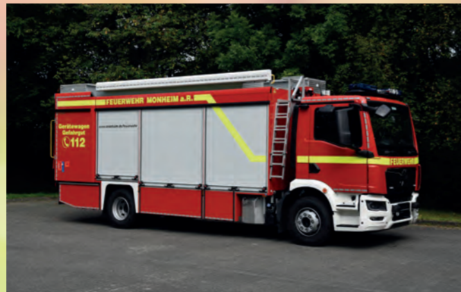
Gerätewagen-Gefahrgut nach DIN 14555-12