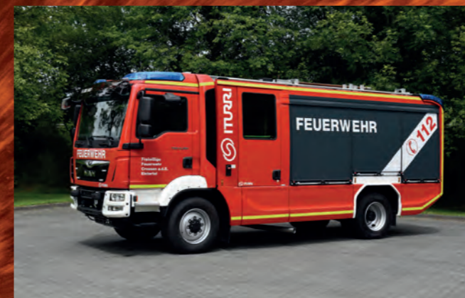
Hilfeleistungslöschgruppenfahrzeug HLF 20 mit AP3 Aufbau