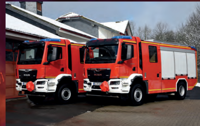
Tanklöschfahrzeug TLF 3000