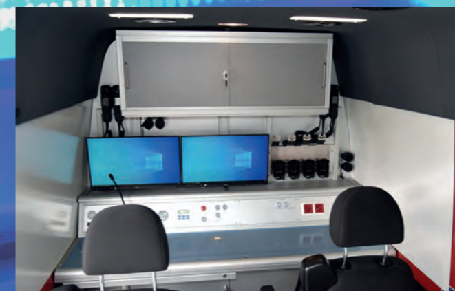
Lageführungsplatz Einsatzleitwagen ELW 2