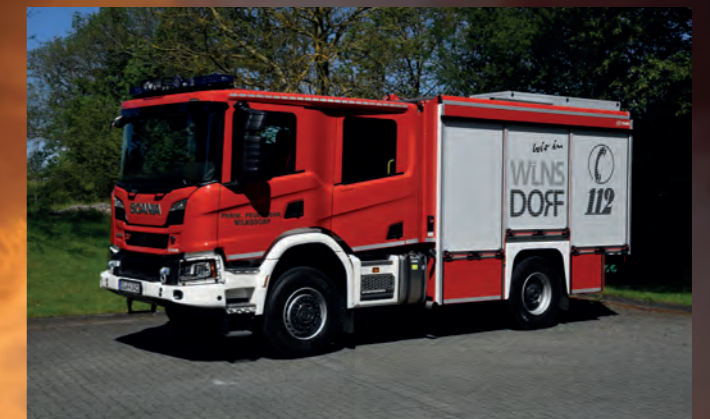
Tanklöschfahrzeug TLF 4000