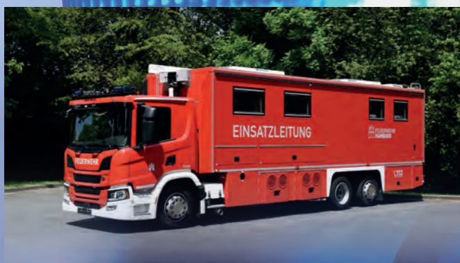
Einsatzleitwagen ELW 2 nach DIN 14507-3