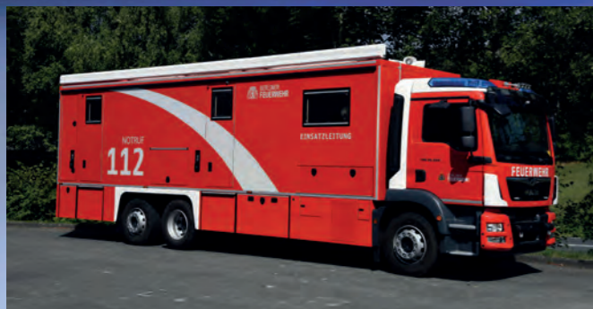
Einsatzleitwagen ELW 2 nach DIN 14507-3