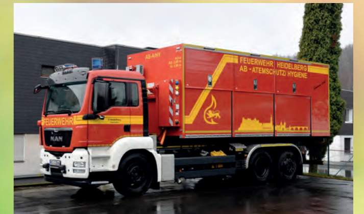
Abrollbehälter-Atenschutz/Strahlenschutz nach DIN 14505