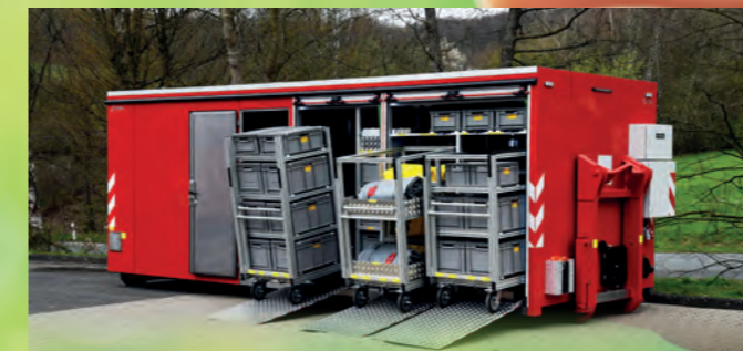
Abrollbehälter-Dekon/Hygiene für die Einsatzkräfte nach DIN 14505