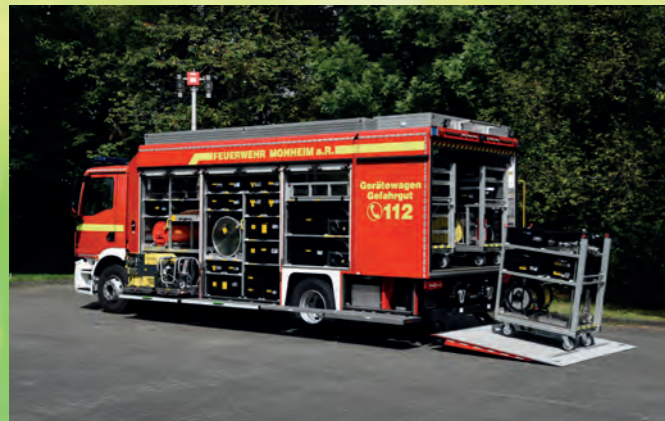
Gerätewagen-Gefahrgut mit tiefgezogenem Rollladenaufbau, Heckraumzelle und hydr. Ladebordwand