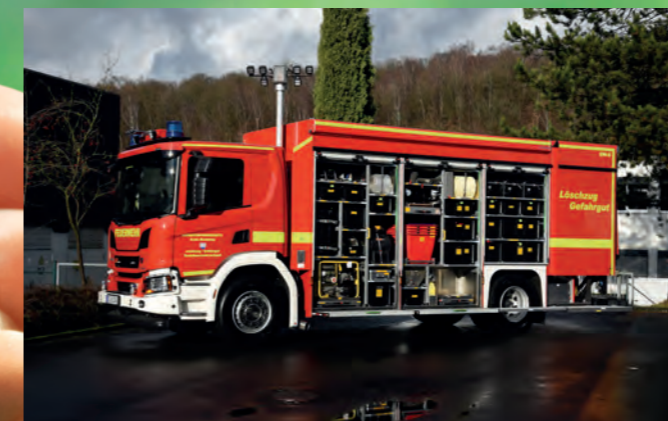
Gerätewagen-Gefahrgut nach DIN 14555-12