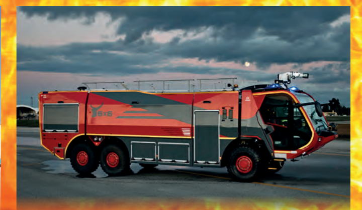
Flugfeldlöschfahrzeug FLF Toro 6 x 6