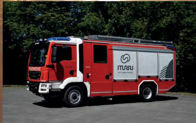
Hilfeleistungslöschgruppenfahrzeug HLF 20 mit AP3-Aufbau

Wir fertigen das perfekt auf Ihre Bedürfnisse angepasste Einsatzmittel für Sie!