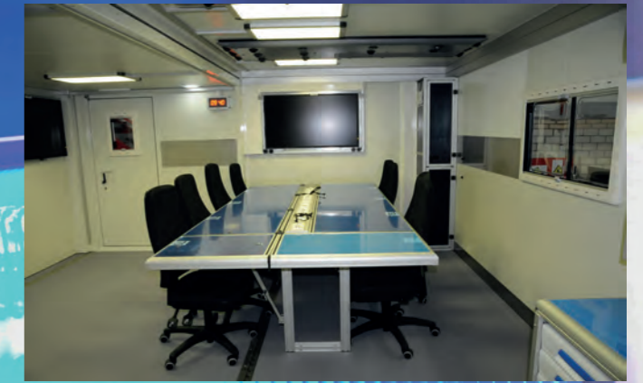
Besprechungsraum Einsatzleitwagen ELW 3