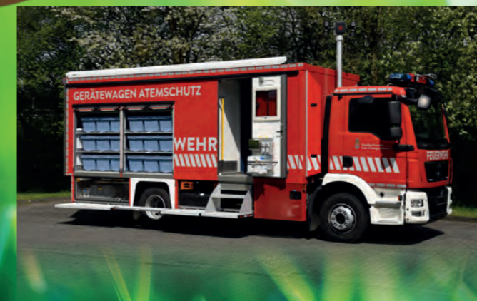
Gerätewagen-Atenschutz nach DIN