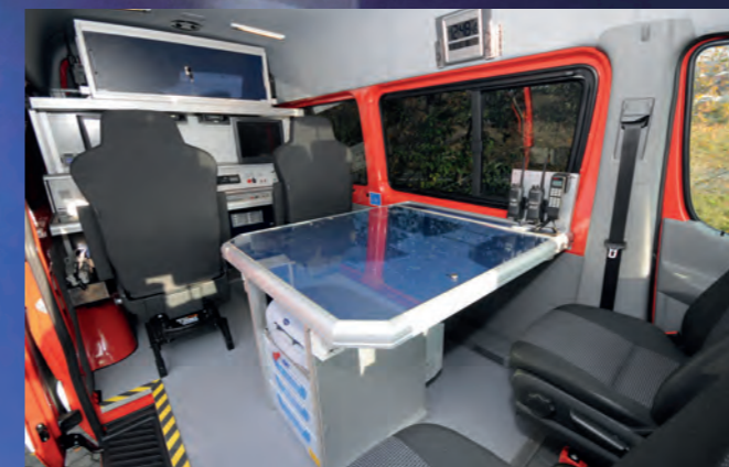
Innenansicht Einsatzleitwagen ELW 1