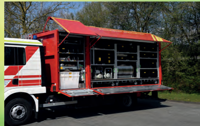
Gerätewagen-Gefahrgut mit HuRoWa-Aufbau