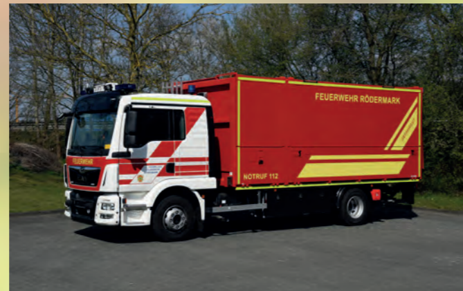
Gerätewagen-Gefahrgut mit HuRoWa-Aufbau