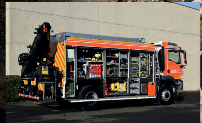
Rüstwagen mit Kran