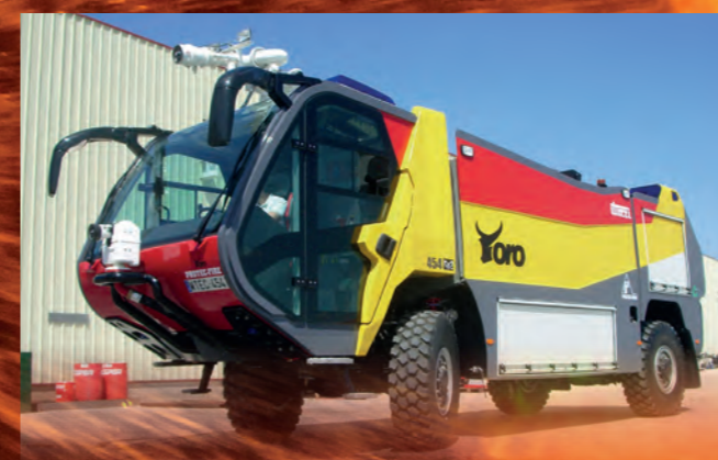
Flugfeldlöschfahrzeug FLF Toro 4 x 4

Egal ob groß oder klein, für einen militärischen oder zivilen Flughafen: Unsere FLF und GTLF sind von höchster Qualität und sind auf Sicherheit abgestimmt. Die Anforderungen für den Brandschutz an Flughäfen unterliegen internationalen Regelungen. Wir kennen uns damit aus und dürfen schon weltweit liefern. Neben der Erfüllung der gesetzlichen Anforderungen benötigen Sie vor allem ein verlässliches, leistungsfähiges und langlebiges Fahrzeug.