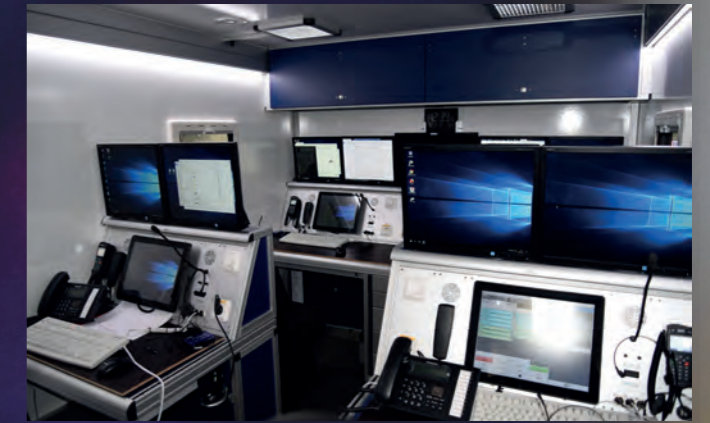
Innenansicht Einsatzleitwagen ELW 2