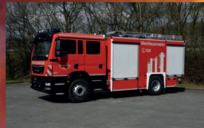
Tanklöschfahrzeug TLF 5000