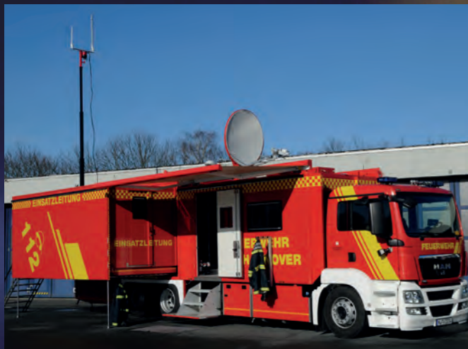
Einsatzleitwagen ELW 3 nach DIN 14507-3 mit Seitenauszug und Satellitentechnologie

Und für die gesamte Lebensdauer des Fahrzeugs können Sie auf uns zählen – bei Umbau, Anpassung oder Unfallinstandsetzung, wann immer es notwendig wird!