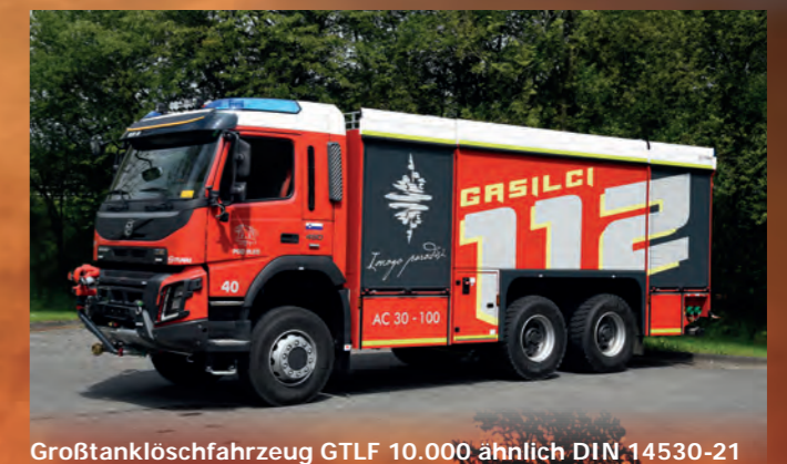
Großtanklöschfahrzeug GTLF 10.000 ähnlich DIN 14530-21