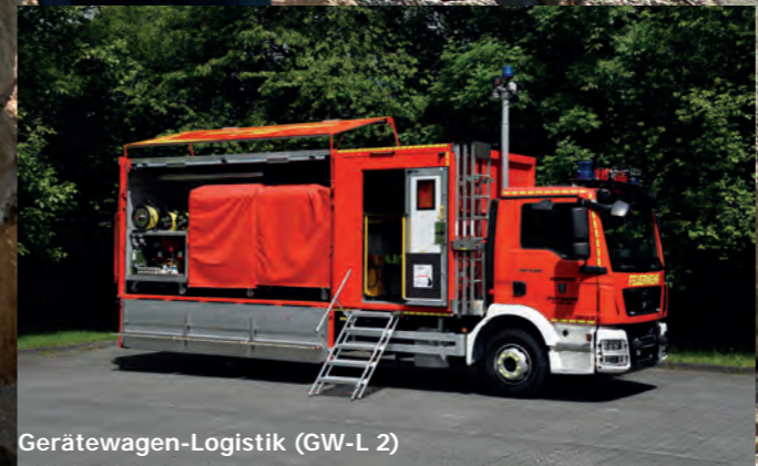
Gerätewagen-Logistik (GW-L 2)