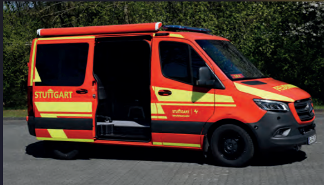
Einsatzleitwagen ELW 1 nach DIN 14507-2

Großbrände, Terrorangriffe, Naturkatastrophen oder größere technische Hilfeleistungen: