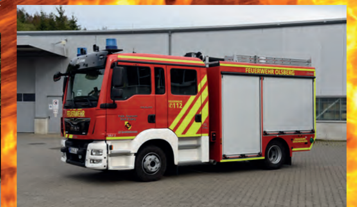
Mittleres Löschfahrzeug MLF mit EPF-Aufbau (Eco-Poly-Fire)