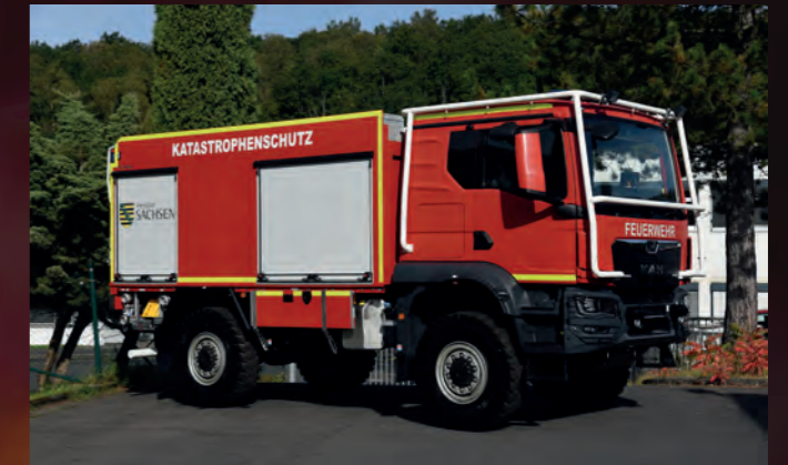
Waldbrand Tanklöschfahrzeug TLF 3000