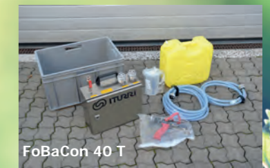
FoBaCon 40 T